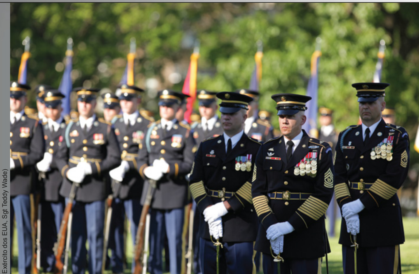
(Exército dos EUA, Sgt. Teddy Wade)