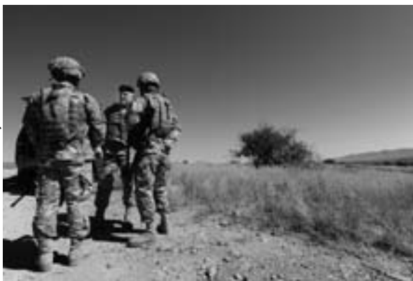
O Gen Bda Peter Aylward, dos EUA, conversa com soldados da Guarda Nacional do Arizona perto da cidade de Nogales, enquanto visita tropas que estão em apoio à Polícia de Fronteira dos EUA, 13 Set 10.

modo dramático de como ocorreram as mortes, no sentido de mobilizar os cidadãos norte-americanos, ao ponto de levar a considerações de que o México poderia ser um Estado fracassado, o país exibe todas as características de uma democracia jovem e batalhadora. No entanto, sem apoio significativo, ela facilmente pode recorrer a práticas semiautoritárias que viriam a encorajar e a capacitar os cartéis a atuarem fora da influência do governo mexicano. Ainda assim, um retorno a um governo semiautoritário ou mesmo autoritário não significa que o Estado irá fracassar.