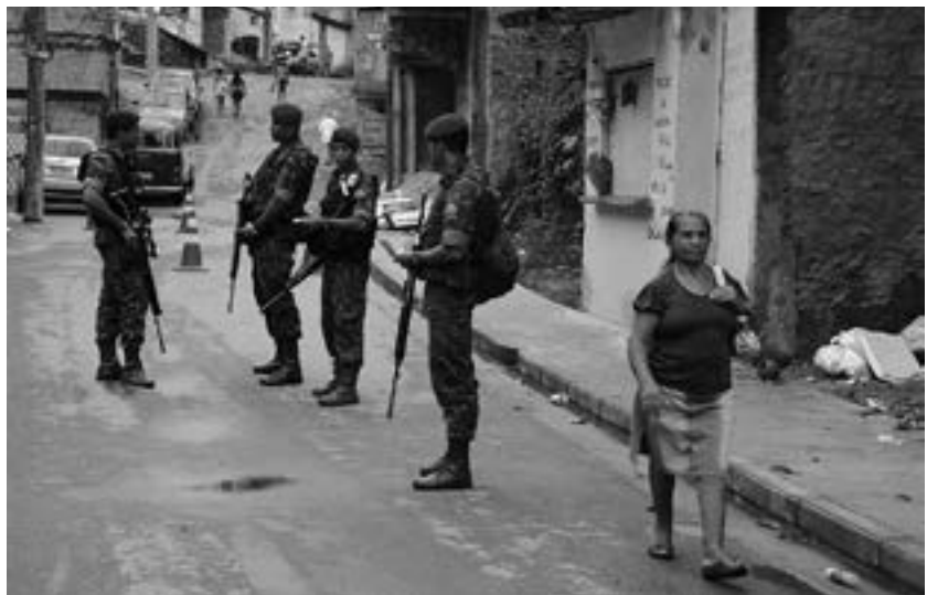
Integrantes da Força de Pacificação dos Complexos do Alemão e da Penha proporcionam segurança em uma via durante a Operação Arcanjo, na cidade do Rio de Janeiro.

É um erro querer resolver questões tradicionalmente direcionadas à área civil somente