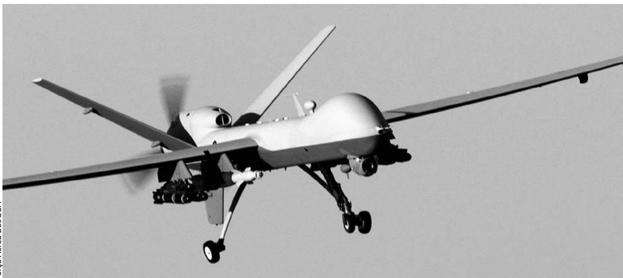
VANT MQ-9 Reaper se prepara para aterrissagem depois de missão em apoio à Operação Enduring Freedom , no Afeganistão, 17 Dez 07. O Reaper tem a capacidade de transportar bombas de precisão e mísseis ar-terra.

militar. Um indício de que é esse o caso, afirmam eles, é o fato de que a CIA — agência que mais emprega VANT armados para a caça de terroristas transnacionais — atua, historicamente, fora do âmbito das leis e regulamentos militares e não é regida pelas Convenções de Genebra nem se beneficia de suas proteções. Segundo esse argumento, o fato de os ataques de VANT serem conduzidos, de modo geral, pela CIA e, assim, regidos pelo direito civil e não pelo direito militar significa que eles são um tipo de assassinato político, algo que é expressamente proibido tanto pelo direito internacional quanto por atos do poder executivo nacional.