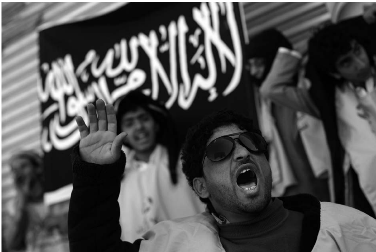
Manifestante iemenita critica ataques de VANT norte-americanos em protesto diante da residência do Presidente do Iêmen, Abed Rabbu Mansour Hadi, em Sanaa, 28 Jan 13.

de fato, infringindo alguma lei com seu emprego de VANT armados.