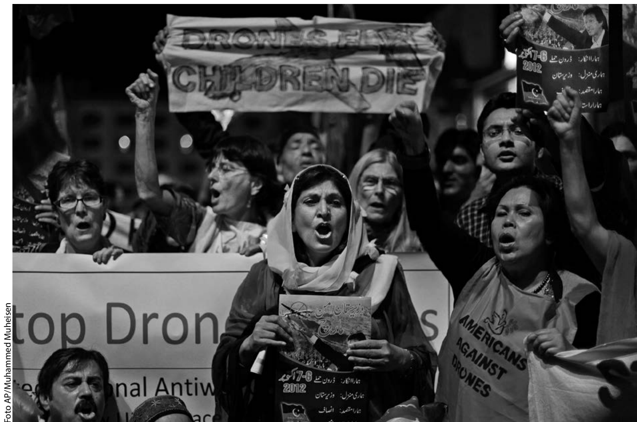
Cidadãos paquistaneses e norte-americanos seguram banners e entoam slogans contra os ataques de VANT na faixa tribal do Paquistão, em Islamabad, 05 Out 12.

Cabe ressaltar que este artigo não propõe que conduzir a guerra por intermédio de robôs armados seja antiético. Minha tese é, na verdade, que a forma pela qual os EUA utilizam os VANT é profundamente imprudente, por parecer antiética justamente às populações estrangeiras de cuja aprovação o país mais precisa — aquelas entre as quais os inimigos se escondem, as do mundo