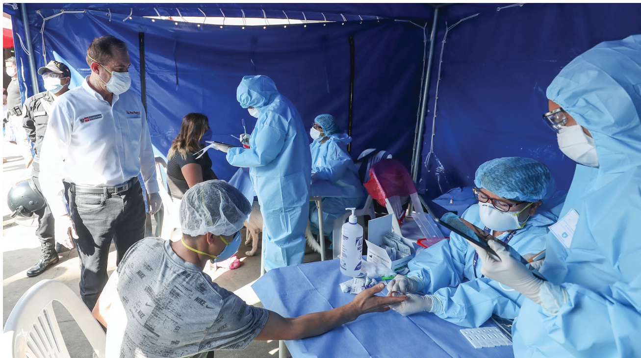
El ministro de Defensa, Walter Martos, supervisa la toma de pruebas del COVID-19 a comerciantes del mercado Caquetá como parte de la estrategia del grupo multisectorial «Te Cuido Perú» para cortar la cadena de contagio.

al director de Salud del Ejército y su equipo para integrarlo. De manera simultánea, la titular de este comando, la ex ministra de Salud Pilar Mazzetti, procedió a conformar comandos de operaciones regionales con la misma misión, pero en el ámbito de las respectivas regiones del país. En virtud de ello, el comandante general de la 7ª Brigada de Infantería y el jefe de Estado Mayor de la III División de Ejército fueron designados como jefes de los comandos COVID-19 en Lambayeque y Arequipa respectivamente. Asimismo, en la gran mayoría de las 22 regiones restantes, se designó a diferentes oficiales del Ejército como integrantes de estos comandos regionales, los mismos que están participando activamente en la toma de decisiones e implementación de medidas urgentes de alcance multisectorial que permitan enfrentar la pandemia. En el caso de Arequipa, por ejemplo, el comando regional ha diseñado toda una estrategia para implementar el Plan Regional de Salud, integrando los esfuerzos del Gobierno Regional de Arequipa, del Ministerio Público, la Gerencia Regional de Salud del MINSA y ESSALUD, de las clínicas privadas y de la Sanidad de las FFAA y Policiales y de la Defensoría del Pueblo, entre otras dependencias de la región. Pese a que el enfoque de las funciones principales del comando es la integración de los esfuerzos de salud en