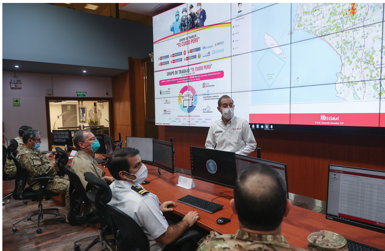
La plataforma digital «Te Cuido Perú» integra bases de datos del MINSA, ESSALUD, FF. AA. y otros, y permite geolocalizar a personas con el COVID-19. La plataforma también permite llevar a cabo el aislamiento, seguimiento médico y soporte emocional, apoyo alimentario y vigilancia las 24 horas.

está conformado por representantes de la PCM, MININTER, MTC, MINSA, ESSALUD, CCFFAA, PNP, INDECI, RENIEC y OSIPTEL, entre otros. Entre sus responsabilidades está el diseño y puesta en funcionamiento de una plataforma digital que permite la trazabilidad de los casos positivos y la población vulnerable, la detección, seguimiento médico y soporte emocional de los contagiados y una vez que son identificados, el grupo está a cargo del control de su aislamiento domiciliario, la provisión de un apoyo alimentario periódico y la vigilancia de sus desplazamientos y los de su entorno, así como el tratamiento de los fallecidos. Nuestro Ejército, a través de cinco generales de brigada y otros oficiales superiores, está liderando diferentes responsabilidades dentro de este grupo de trabajo, tales como la implementación de la plataforma digital, el seguimiento y soporte emocional, el control de aislamiento de las personas que hayan salido positivas, la implementación de la vigilancia física de la población vulnerable y el manejo de los fallecidos, dado su alto riesgo. Todos estos componentes interactúan