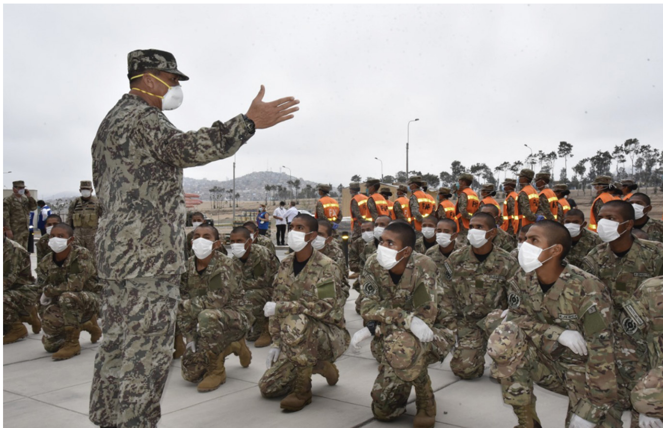
El comandante general del Ejército del Perú, Jorge Céliz Kuong, se dirige a tropas de la 1ª Brigada de Fuerzas Especiales antes de ser desplegadas en la lucha contra el COVID-19 en la base de Chorrillos, en Lima, Perú.

diariamente en entornos multisectoriales, diseñando iniciativas, planteando propuestas, solucionando desfases y carencias y enfrentando eficazmente, a pesar de las evidentes limitaciones, las realidades que nos plantea esta pandemia.