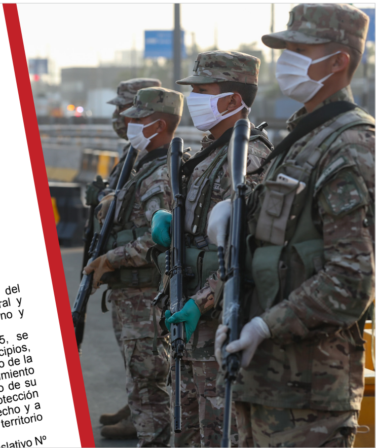
Decreto Supremo que aprueba el Reglamento del Decreto Legislativo Nro. 1095, en el cual se establecen las reglas de empleo y uso de la fuerza por parte de las Fuerzas Armadas en territorio nacional. (Documento: Ministerio de Defensa)

la intervención de nuestras fuerzas se efectúe al amparo del Decreto Legislativo 1095 y que la PNP, con el apoyo de las Fuerzas Armadas, puedan verificar e intervenir a personas, bienes, vehículos, locales y establecimientos que sean necesarios, así como ejecutar el control de la libertad de tránsito en vehículos particulares, transporte público u otros medios.