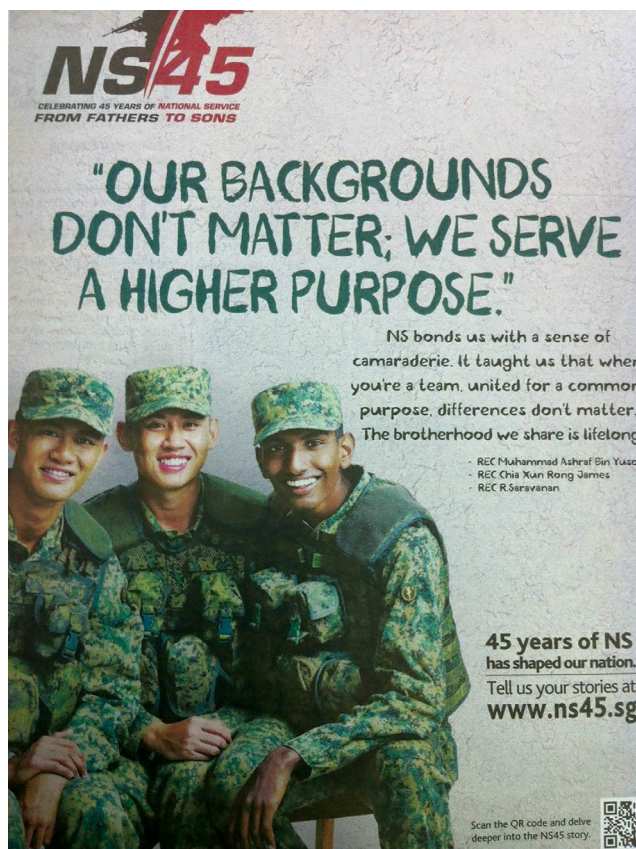
Um pôster promocional do Serviço Nacional, de um ano anterior. As Forças Armadas de Cingapura comemoram o 50º aniversário do Serviço Nacional, em 2017.

Em todas essas ocasiões, as FAC têm proporcionado a gerações de conscritos uma oportunidade para ficar, ombro a ombro, com outros cingapurianos durante crises, assim fortalecendo a sua identidade com o país e, assim, ajudando uma população heterogênea a agir e sentir-se unida.