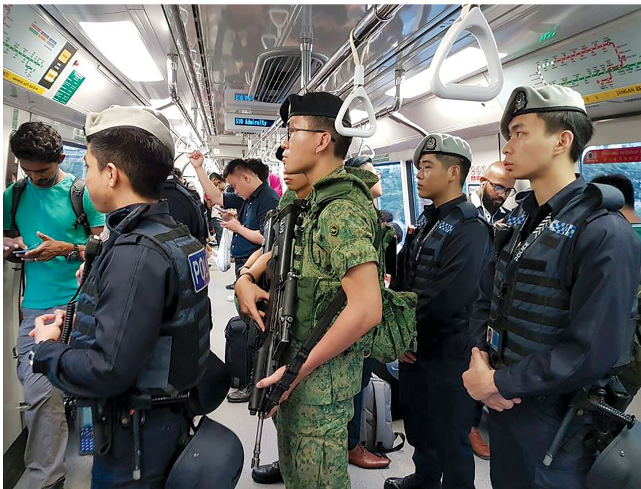
Militares cingapurianos juntos com uma patrulha policial a bordo de um trem subterrâneo. Os militares do Serviço Nacional fazem contribuições significativas para a defesa, como a melhoria das operações de segurança doméstica.

comemorou o seu 50º aniversário, ele foi reconhecido pelo primeiro ministro como uma instituição chave das FAC. Ele continua exercendo um papel importante na segurança de Cingapura, particularmente na assimilação de valores, como a liderança pelo exemplo e a superação da adversidade com a coragem 12 .