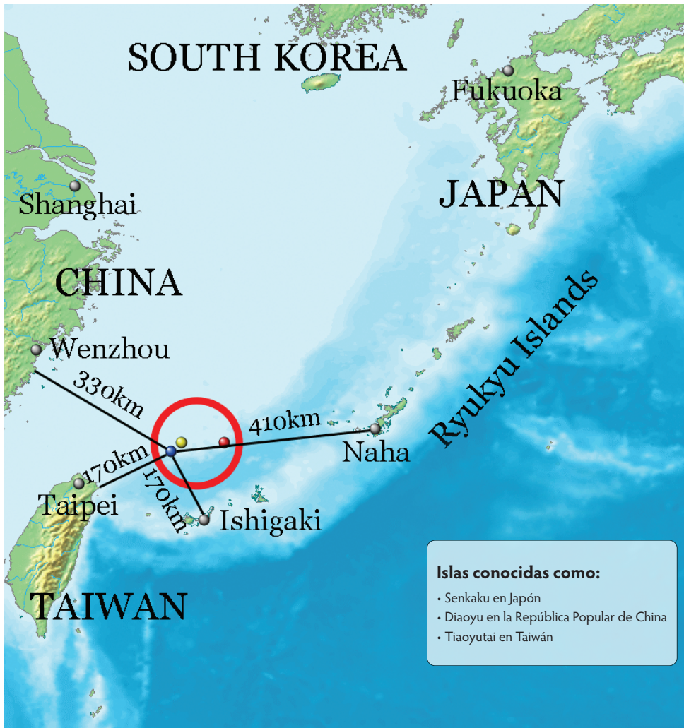
(leyenda traducida)