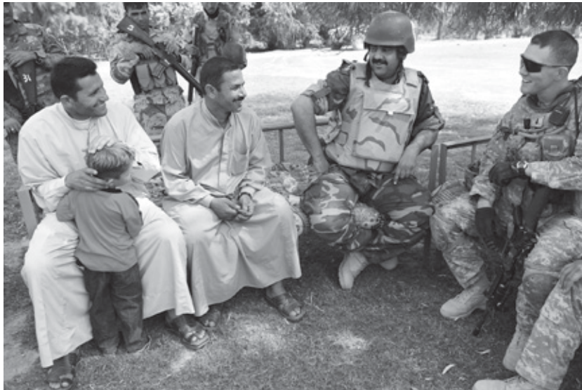
Foto: Un jefe de pelotón, junto con soldados del Ejército iraquí, habla con habitantes de la zona de Nahia Wehda, localizada en las afueras al este de Bagdad, en una patrulla integrada a pie, 6 de junio, para distribuir los sistemas de purificación de agua que se necesitaban en el área, evaluar la seguridad en la zona y discutir las preocupaciones de la población.

De manera que, para algunos, James era simplemente un forajido violento empeñado en asaltar trenes cargados con efectivo mediante el uso de tácticas insurgentes violentas.