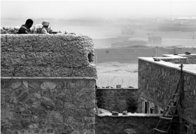
Un infante de la Marina de EUA del 3 er Batallón, 8 o Regimiento de la Infantería de Marina y un oficial de la Policía Nacional afgana proveen seguridad en Delaram, Farah, Afganistán, 23 de marzo de 2009.

destrucción masiva por parte de los terroristas. Aunque los análisis forenses nucleares han progresado, es muy probable que en caso de un ataque nuclear terrorista, no seamos capaces de determinar de dónde provinieron las armas y de qué manera las obtuvieron. (¿Alguien se las brindó? ¿Tuvieron que sobornar o robaron a altas horas de la noche?) Solamente esta ausencia de “pistas del remitente” y la incapacidad resultante de disuadir los ataques de armas de destrucción masiva con una amenaza de represalia nos lleva a reconocer que los terroristas no pueden ser tratados como soldados.