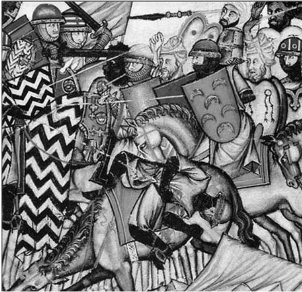
La Batalla de Las Navas de Tolosa. Alfonso X, Cantigas de Santa María (cerca de 1260 -1270). T.I.1 fol. 92, Madrid, Biblioteca Nacional.

Sin embargo, dichas metodologías basadas en procesos son inadecuadas en las acciones centradas en la comunidad, en las cuales el uso de la fuerza tienen efectos de segundo o tercer orden (o mayores) que, frecuentemente, socavan los resultados deseados. Si los planificadores buscan comprender un sistema humano en el cual la religión juega un rol significativo, necesitan recordar la complejidad inherente de la experiencia religiosa individual y sus muchas dimensiones sociales. En concreto, los planificadores y pensadores que participan en el proceso de Diseño deben tener en cuenta las siguientes pautas al evaluar el posible efecto que puede surtir la religión en el ambiente estratégico u operacional.