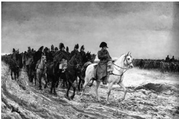
IMAGEN: Campaña de Francia, Meissonier, Jean-Louis-Ernest, 1864, Oleo sobre lienzo.