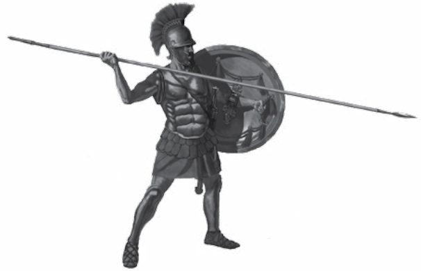
IMAGEN: un hoplita del IV siglo a.C., por Johnny Shumate.

Mientras avanzábamos hacia la cima de una colina desde la cual se esperaba poder ver el campamento de Harris y, posiblemente, encontrar a sus soldados preparados en formación para enfrentarnos, los latidos de mi corazón iban de rápido a más rápido hasta sentirlo en la garganta. En ese momento, hubiera dado cualquier cosa por estar de nuevo en el estado de Illinois, pero no tuve el coraje moral para detenerme y considerar qué hacer; continué avanzando. Cuando llegamos al punto desde el cual el valle estaba a plena vista, nos detuvimos. El lugar donde, unos días antes, había acampado Harris aún estaba allí y los indicios de un reciente campamento eran obvios, sin embargo, las tropas se habían retirado del lugar. Mi corazón volvió a su lugar. Inmediatamente, me di cuenta de que Harris tenía tanto miedo de mí como yo de él. Esta fue una perspectiva de la pregunta que antes jamás me había hecho; pero fue una perspectiva que después jamás olvidé. Desde ese suceso hasta que terminó la guerra, jamás volví a sentir trepidación alguna cuando enfrentaba a un enemigo, aunque a veces