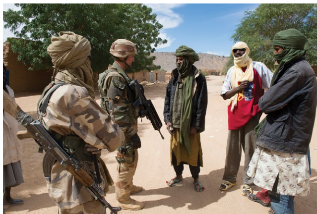
Un soldado francés se reúne con habitantes del lugar, 11 de febrero de 2013, durante la Operación Serval en Mali.

La primera unidad terrestre francesa que aterrizó en Bamako fue llamada el Groupement Tactique Interarmes N° 1 (GTIA 1, por sus siglas en francés, o Grupo de Combate Núm. 1, un batallón reforzado). Estaba compuesto de un cuartel general y una compañía de infantería del 21° Regimiento de Infantería Marina y dos pelotones de vehículos ligeros rodantes (conocidos como el ERC 90, o engine à roues, canon de 90 millimètres ) del Primer Regimiento de Caballería de la Legión