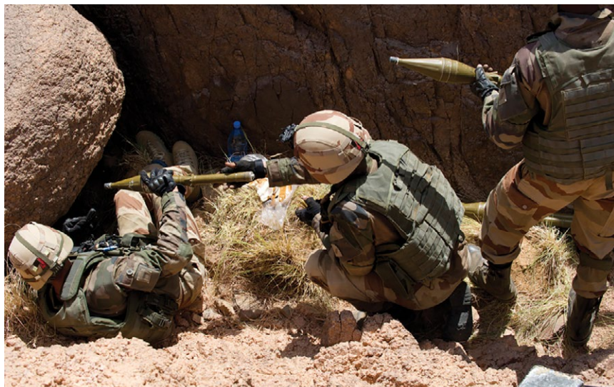
Soldados franceses llevan a cabo una búsqueda de municiones en las colinas cerca de Tigharghar en Mali, marzo de 2013.