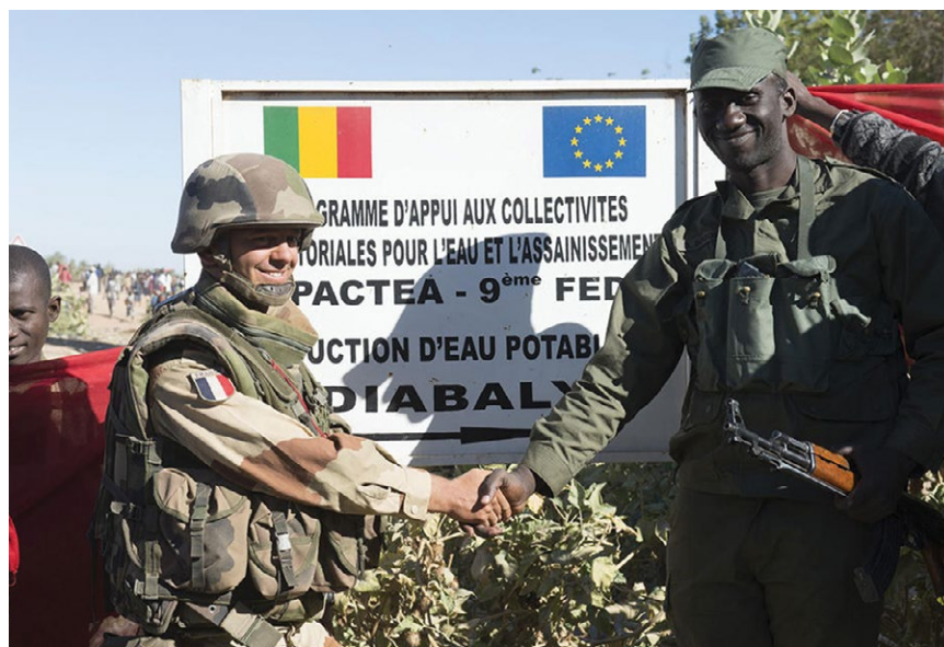
Tropas francesas y malienses estrechan la mano, 21 de enero de 2013, en Diabaly, Mali, después de que las fuerzas malienses, con el apoyo del Ejército francés, retomaron el control de dos pueblos malienses de los terroristas.

Las lecciones de la fase 2: el despeje de la región Gao de la cordillera de Adrar des Ifoghas. En la fase de combate, las unidades francesas aprovecharon sus experiencias de combate en Afganistán. Muchos soldados de la Operación Serval lucharon en los valles de la provincia Kapisa, incluso en el verano de 2011. El número de bajas en Mali siguió siendo muy bajo debido a su capacidad táctica y la calidad de su equipo