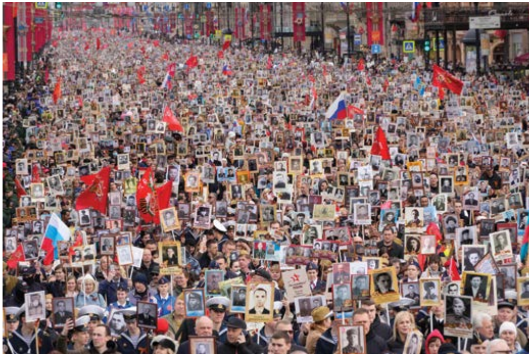
Varias personas portan retratos de familiares que lucharon en la Segunda Guerra Mundial durante la marcha del Regimiento Inmortal del 9 de mayo de 2022 en Nevsky Prospect, la calle principal de San Petersburgo (Rusia), en conmemoración del septuagésimo séptimo aniversario del final de la Segunda Guerra Mundial.

A principios del nuevo milenio, los conservadores filosóficos y los nacionalistas rusos acogieron la idea de que Rusia es una civilización euroasiática distintiva, con derecho no solo a sus propios valores, sino a su propio espacio geográfico ampliamente definido. Este heterogéneo y ecléctico grupo de defensores abarcaba desde el ultranacionalista Vladímir Zhirinovskii, pasando por el líder del partido comunista Genadii Ziuganov, hasta Alexander Dugin, un antiguo filósofo político de la Universidad de Moscú con opiniones fuertemente antioccidentales. Los escritos del geógrafo político e historiador euroasiático Lev Gumilev, cuya obra tiende un puente entre las épocas soviética y postsoviética, también encontraron un público entusiasta 11 .