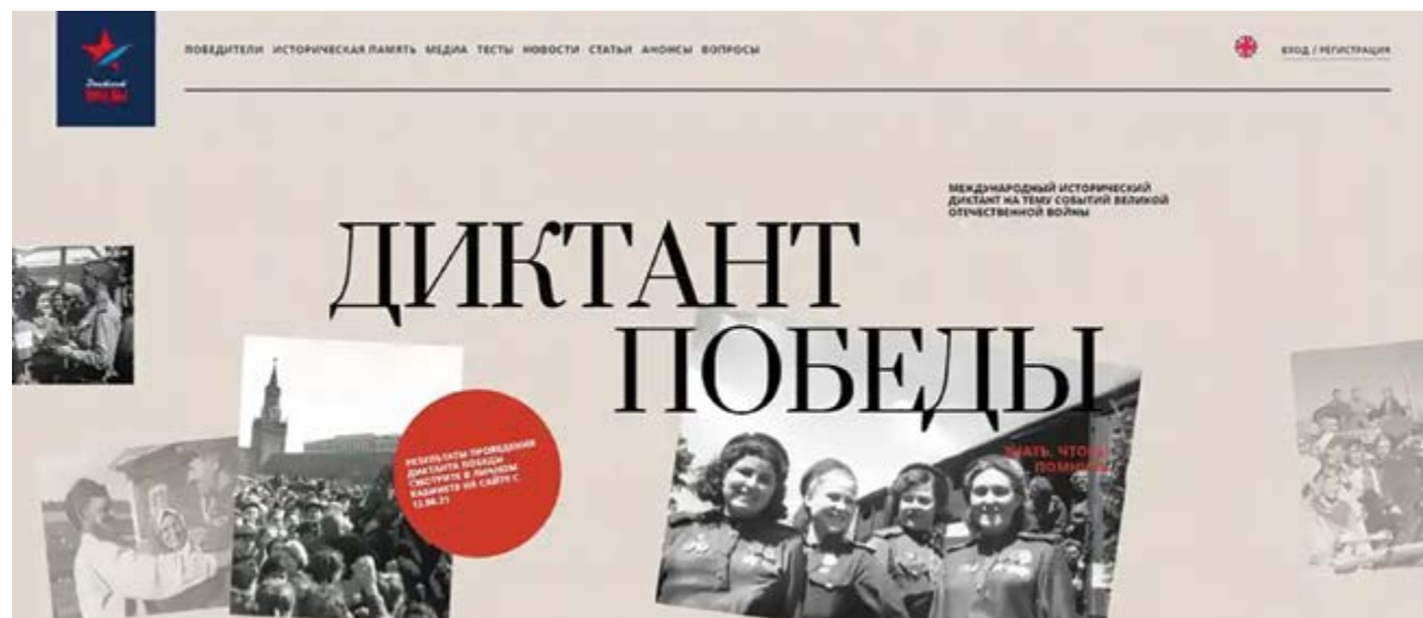
Página oficial de «Diktant Pobedy» (Ensayo de la Victoria)

En algunos casos, los grupos de música rusos han tenido que sufrir la cancelación de conciertos tras declaraciones o acciones consideradas críticas con la guerra. El popular grupo de rock Mashina Vremeni (Máquina del Tiempo) y su cantante Andrei Makarevich tienen el honor de haber visto cancelados sus conciertos tanto por el antiguo régimen soviético como por el actual de Putin. Otra venerable banda rusa, B-2, sufrió la cancelación de un concierto en San Petersburgo el 17 de junio. La razón fue que se habían negado a actuar delante de una pancarta a favor de la guerra en Omsk, Siberia, en abril. Otro grupo muy popular, DDT, y su cantante Yuri Shevchuk se manifestaron en contra de la invasión y sus conciertos en Moscú fueron cancelados 41 .