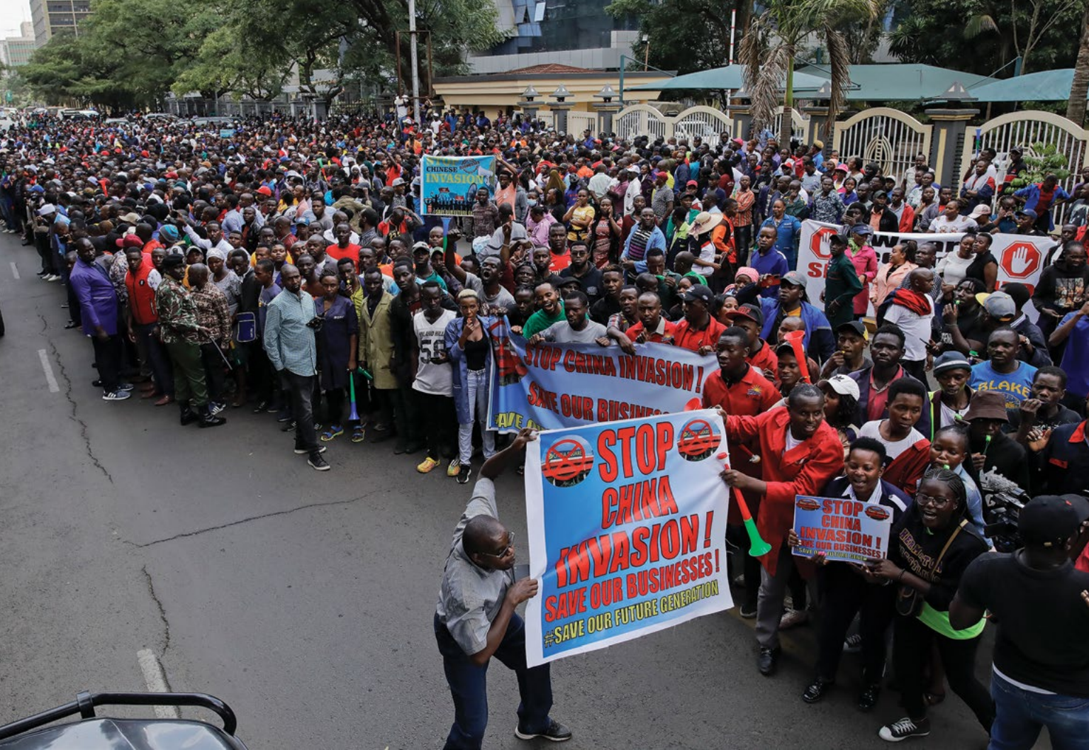
Comerciantes kenianos se manifiestan el 28 de febrero de 2023 en Nairobi contra las ventajas comerciales injustas para los ciudadanos chinos en el país que se dedican a la importación, fabricación y distribución de bienes.