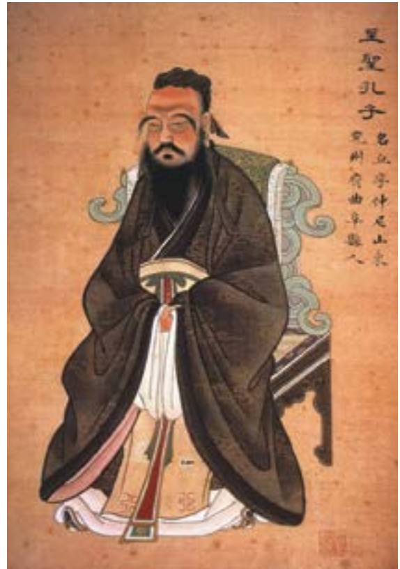
Representación de Confucius circa 1770

Véase el libro Unrestricted Warfare de Qiao Liang y Wang Xiangsui (Pekín: PLA Literature and Arts Publishing House, febrero de 1999) en línea en https://citeseerx.ist.psu.edu/doc/10.1.1.169.7179 .