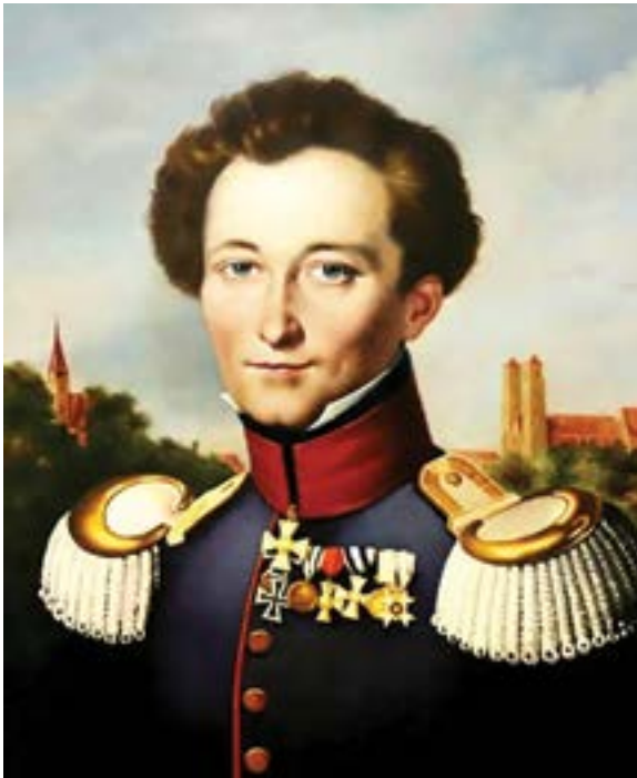
Carl Philipp Gottfried von Clausewitz, 1 de junio de 1780

ambiente actual que exige líderes que comprendan tanto la ciencia como el arte de las operaciones: