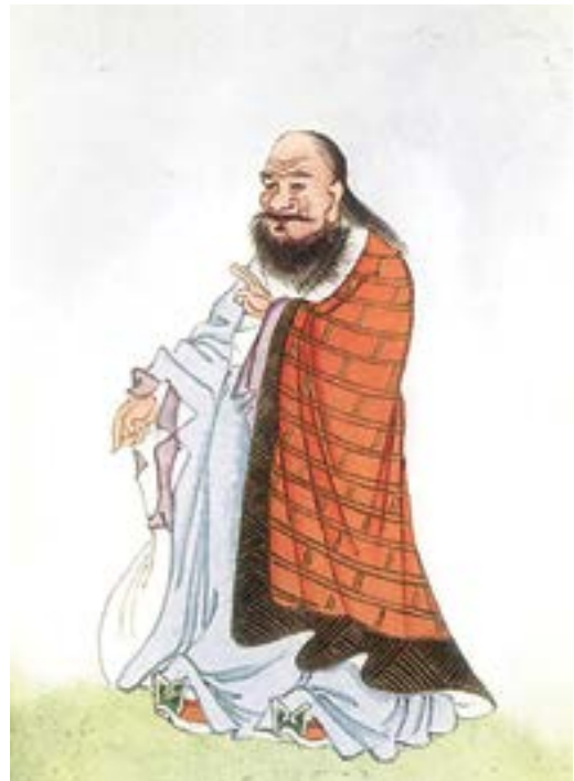
Representación de Lao Tzu en Myths and Legends of China , de E. T. C. Werner (Project Gutenberg, febrero de 1922).

Un análisis del concepto de operaciones multidominio centradas en la tecnología del Ejército de EUA, tal y como se describe en el Manual de Campaña (FM) 3-0, Operations , del Ejército de EUA, ilustrará la diferencia en el planteamiento de cada país. En el presente artículo se analizarán conceptos clave de los períodos feudal y dinástico de China utilizando El arte de la guerra de Sun Tzu y una destilación de las treinta y seis estrategias chinas. Por último, este artículo analizará el moderno arte operacional chino, tal y como lo demostró Mao durante la guerra civil china (1946-1949) y como se describe en la obra de Qiao Liang y Wang Xiangsui, Guerra irrestricta , publicada en 1999. Por lo general, cuando en este artículo se hace referencia al arte operacional, se implica también al arte estratégico y táctico.