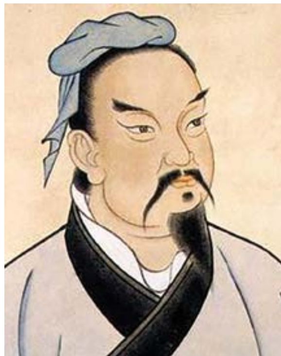
Representación de Sun Tzu en la época Qing