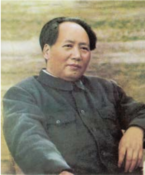
Foto de Mao Zedong sentado, publicada originalmente en Quotations from Chairman Mao Tse-Tung hacia 1955.

hasta que las otras partes se agoten luchando entre sí. Entonces, entrar con todas las fuerzas para acabar con ellos o ganar la posición dominante 33 . La relación de Xi Jinping con Vladimir Putin es un ejemplo de ello. Xi presta un apoyo tácito a Putin, pero observa paciente-mente como Rusia y la OTAN se agotan en Ucrania.