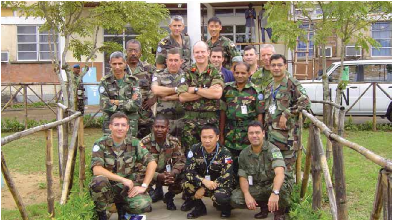
Personal de JMAC en la misión de Naciones Unidas en Liberia. La comunicación en las misiones de la ONU es desarrollada en inglés.

El Comando Conjunto de las Fuerzas Armadas dispuso la implementación de un proyecto de Inglés para las Fuerzas Armadas, el que apoyado en una plataforma virtual, permite el desarrollo de las cuatro habilidades básicas: hablar, escribir, escuchar y leer, mejorando las competencias de cada soldado, ampliando las oportu-