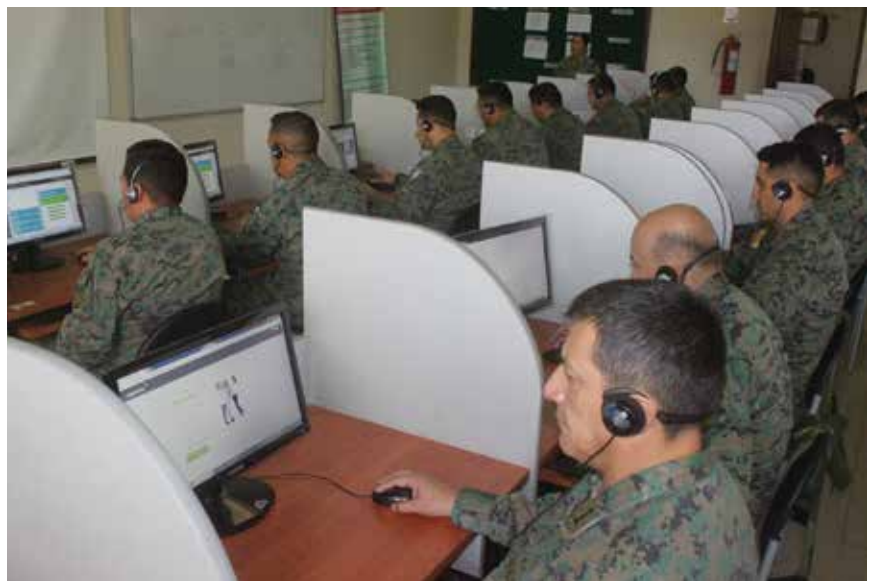
Alumnos de la Academia de Guerra en los laboratorios estudiando en la plataforma de inglés en abril de 2018.

El aprendizaje de una nueva lengua es una oportunidad que cada persona debe considerar para mejorar sus competencias individuales, permitiendo mayores posibilidades de crecimiento personal y grupal.